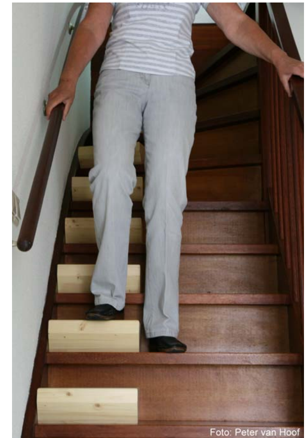
Traplopen is minder belastend

Tegelijkertijd blijft bij deze manier van traplopen de vitaliteit, flexibiliteit, kracht en coördinatie behouden.